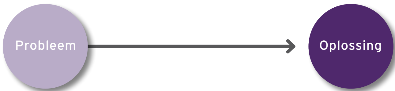
Figuur 2: Het tweestappenmodel

Dit achtstappenplan is het alternatief voor het tweestappenmodel (zie figuur 2) dat vaak wordt gehanteerd bij het oplossen van een vraagstuk en waarvan we inmiddels weten dat het niet werkt.